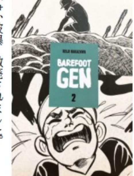
「はだしのゲン」英語版の表紙

して、多くの反対意見が広島市教委に寄せられています。まず、審議過程の公開が不十分であること、教材の内容