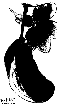
比江山の風になじみし女郎花