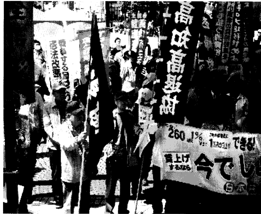
メーデー中央集會に参加した高退協のみなさん